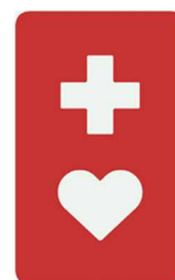
【ヘルプマーク】 所管：東京都