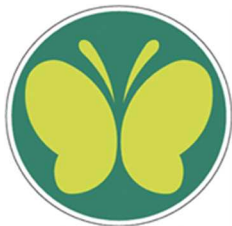
【聴覚障害者標識 (聴覚障害者マーク)】 所管：警察庁