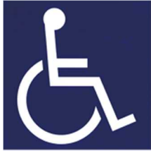
【障害者のための国際シンボルマーク】 所管：公益財団法人日本障害者リハビリテーション協会