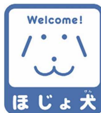
【ほじょ犬マーク】 所管：厚生労働省