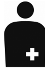
【オストメイト用設備/オストメイト】 所管：公益財団法人 交通エコロジー・モビリティ財団