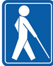
【盲人のための国際シンボルマーク】 所管：社会福祉法人日本盲人福祉委員会