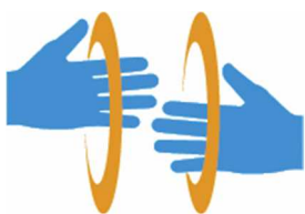
【手話マーク】 所管：一般財団法人全日本ろうあ連盟